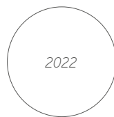
Asien – Stärke des Tigers